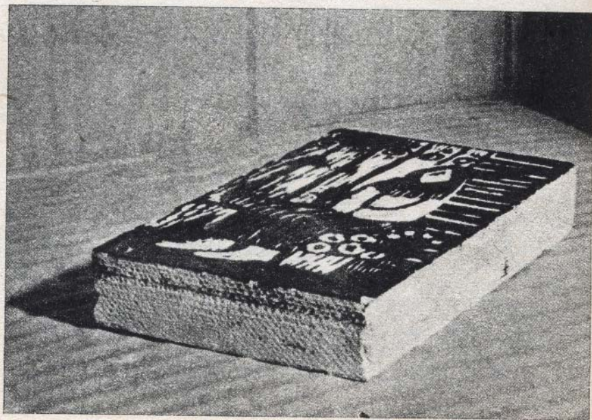
Gotowa płytka gipsowa z wyrytym rysunkiem

Gdy płytka dostatecznie stwardnieje, uginamy z lekka, znajdującą się pod ramką płytkę szklaną, raz z jednej, a potem z drugiej strony, przez co dostaje się tam powietrze i co pozwoli nam na oddzielenie przylegającej szczelnie do gipsu płytki szklanej. Po oddzieleniu szkła, ostrożnie rozbieramy ramkę, by nie uszkodzić płytki. Teraz należy płytkę dostatecznie wysuszyć (nie wysuszoną łatwo uszkodzić), i nasycić tę powierzchnię, na której będziemy wykonywać rysunek, rozcieńczonym klejem stolarskim. Zabieg ten jednak nie jest konieczny.