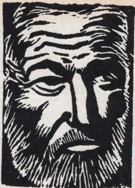
Odbitka gipsorytowa. Autorka Barbara Burza

Płaszczyna płytki w miejscach, które mają być białe, zostaje tak nacięta rylcem, by powstało wgłębienie. Lepiej jest wyciąć z początku mniej materiału i zrobić próbną odbitkę celem zorientowania się, czy wszystko jest w porządku, aniżeli wyciąć go za dużo. Jeśli wytniemy za dużo materiału, trudno nam będzie potem coś poprawić. Gdy wszystkie miejsca, które mają być białymi plamami, zostały dostatecznie z powierzchni gipsu wybrane, wykonujemy właściwą odbitkę. Robimy to w ten sposób: na powierzchnię dość dużej płytki szklanej nakładamy trochę farby drukarskiej lub farby do powielania i rozprowadzamy ją po powierzchni szkła wałkiem (dobrze nadają się do tego celu wałki fotograficzne). Po równomiernym rozłożeniu farby na wałku, przeciągamy nim po powierzchni płytki gipsowej w ten sposób, by się równomiernie pokryła farbą. Teraz bierzemy papier i przykładamy go do powierzchni płytki, a następnie ręką lub brzegiem grzebienia staramy się dobrze docisnąć całą jego powierzchnię do nasyconej farbą powierzchni płytki, by dobrze do niej przyległa. Po odjęciu papieru otrzymujemy gotową odbitkę rysunku. Jeśli nie mamy farby drukarskiej, możemy na powierzchnię płytki nałożyć papier i przytrzymując go palcami (by się nie przesunął) natrzeć jego powierzchnię kredką woskową lub ołówkiem, tak jak to często robimy